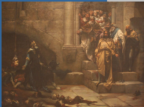
La leyenda del rey monje o la campana de Huesca